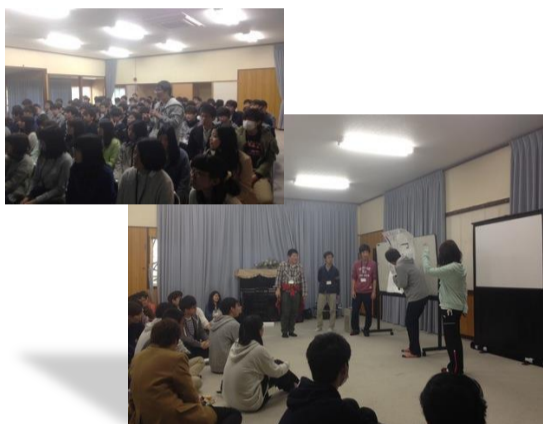
新入生オリエンテーション