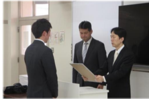
卒業式での学部長表彰