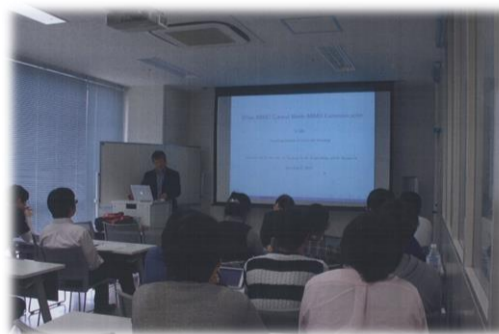
計23回 参加者延べ954名